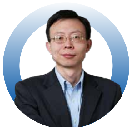
零一创投 创始合伙人