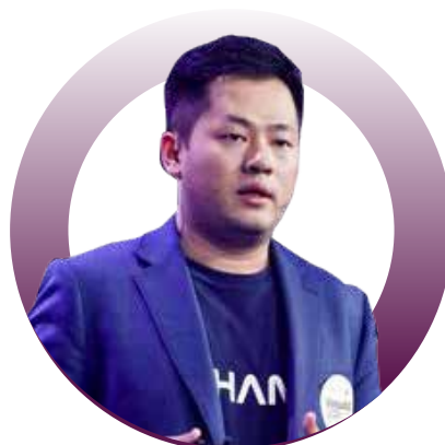
原 亿航智能 联合创始人 首席市场官