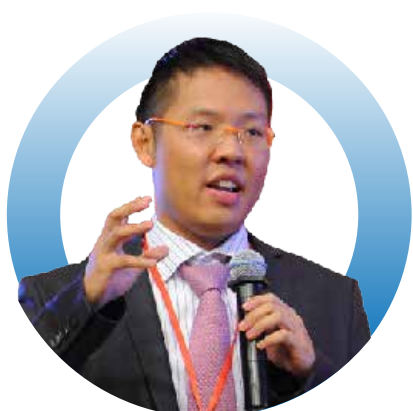
禹徽资本创始合伙人 Carousel Go-Jek投资人