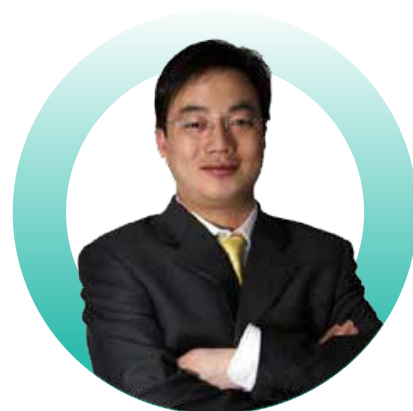
天使投资人 2345及51.com创始人